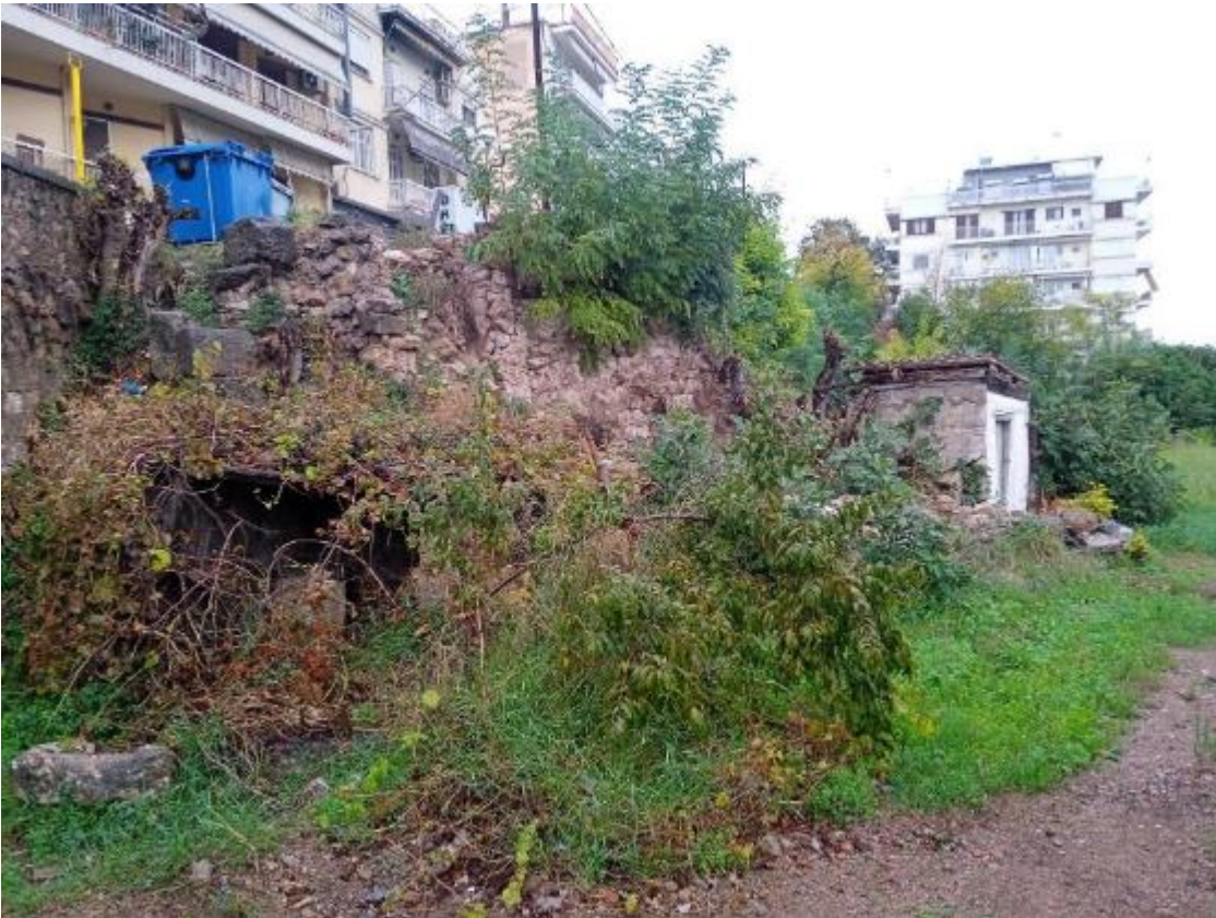
Εικ. 3. Το τμήμα τείχους μετά την κατάρρευση (Νοέμβριος 2023).