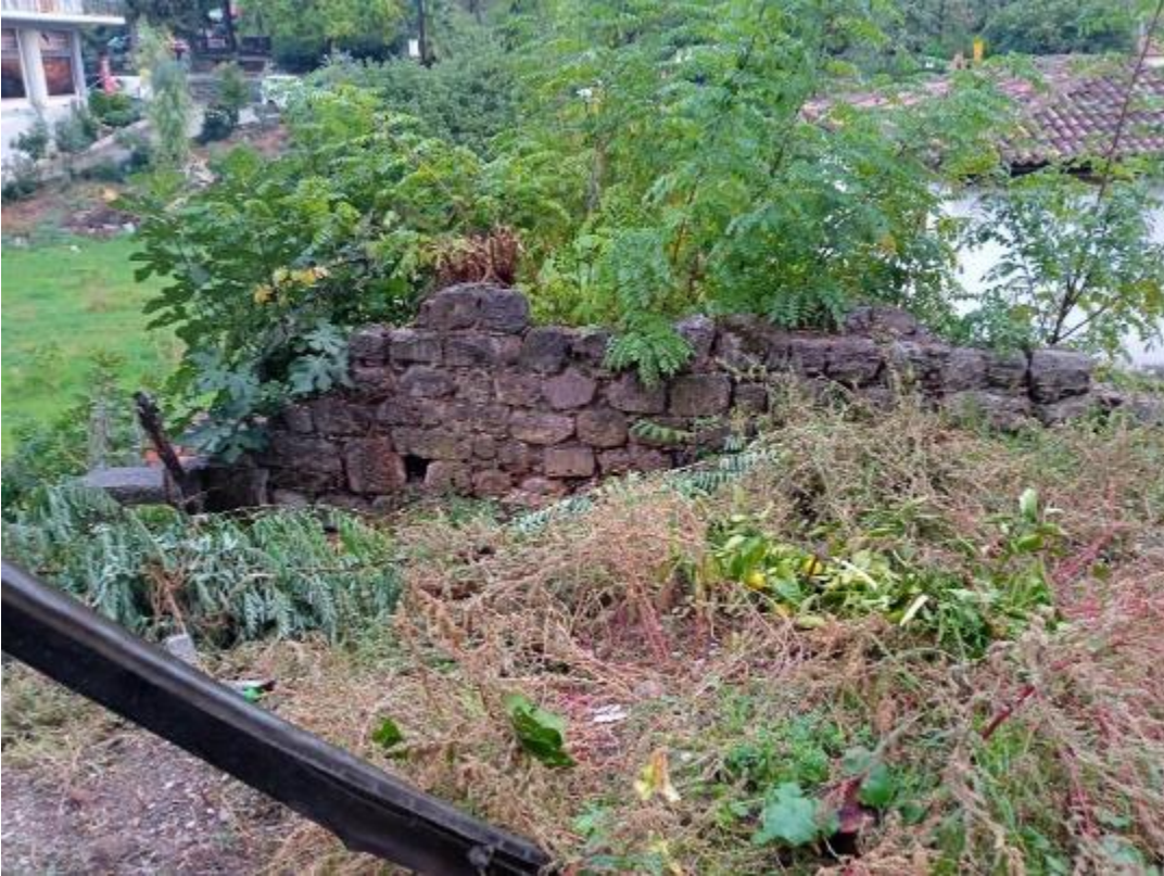
Εικ. 5. Το τμήμα τείχους μετά την κατάρρευση (Νοέμβριος 2023). Δυτική όψη.