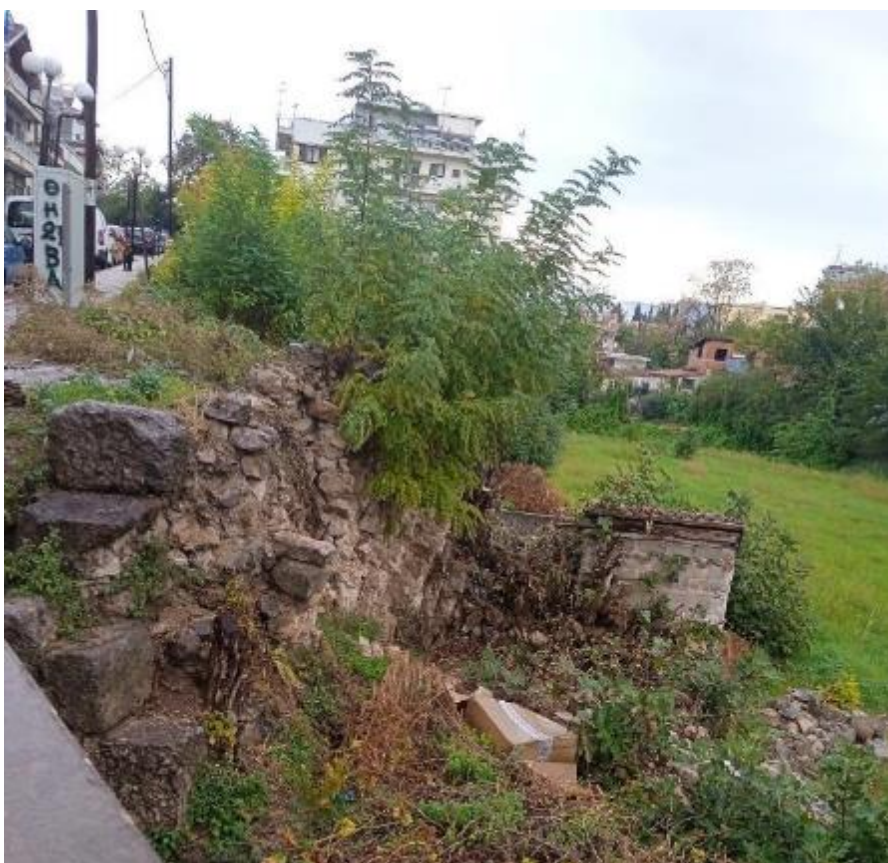
Εικ. 2. Το τμήμα τείχους μετά την κατάρρευση (Νοέμβριος 2023).