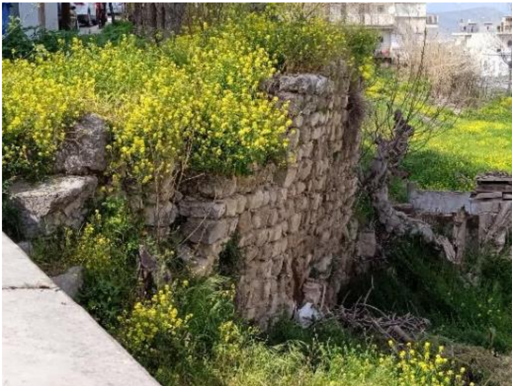
Εικ. 1. Το τμήμα τείχους πριν την κατάρρευση (Μάρτιος 2022).

Επισυνάπτονται ενδεικτικές φωτογραφίες της περιοχής ενδιαφέροντος.