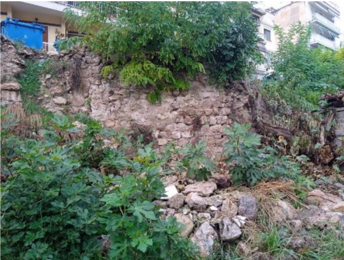
Εικ. 4. Το τμήμα τείχους μετά την κατάρρευση (Νοέμβριος 2023). Ανατολική όψη.